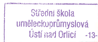
Ing. Zdeněk Salinger ředitel Střední školy uměleckoprůmyslové Ústí nad Orlicí

Počet listů dokumentu: 2 Počet listů příloh: 1