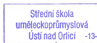
Ing. Zdeněk Salinger ředitel Střední školy uměleckoprůmyslové Ústí nad Orlicí

Počet listů dokumentu: 3 Počet listů příloh: 1